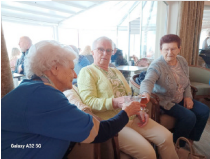
Uitstap naar De Haan